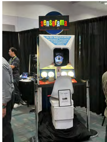
図 1.2 「センソラマ」 7)