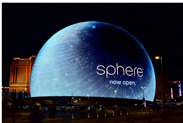
図 1.3 「MSG Sphere」

また、音楽体験も、従来のライブステージの後方の映像とパフォーマンスが別であった体験から、演者の動きを元に後方の映像が自動的に変化するような体験や、AR 技術を応用して演者と CG を重ねる体験などが提案されている。ダンスパフォーマンスの衣装に LED を装着し、同期通信を行うことで衣装をディスプレイとする試みや、ラスベガスの「MSG Sphere」(図 1.3) のように大型の球体スクリーンに映像を映し出して没入する体験を作り出している。